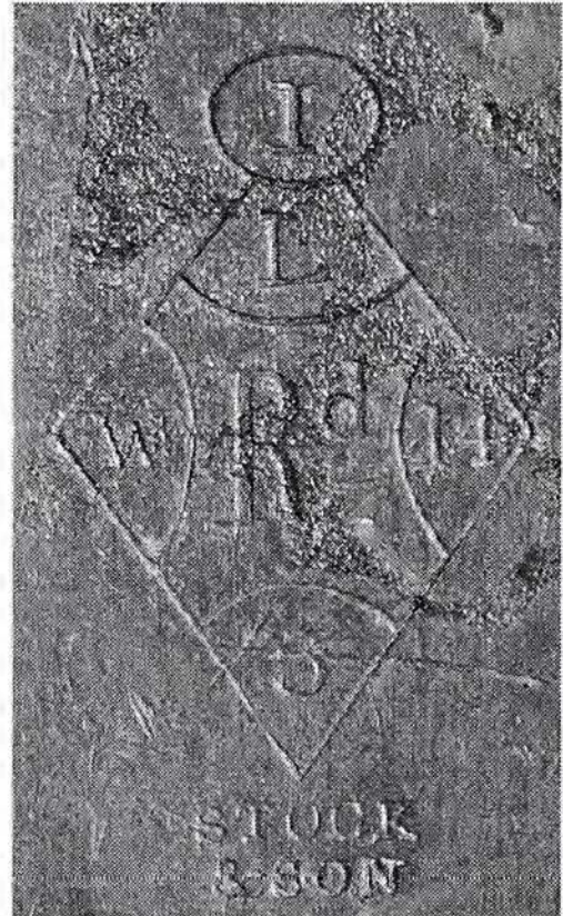
Fabrieksmerk onderkant bodem