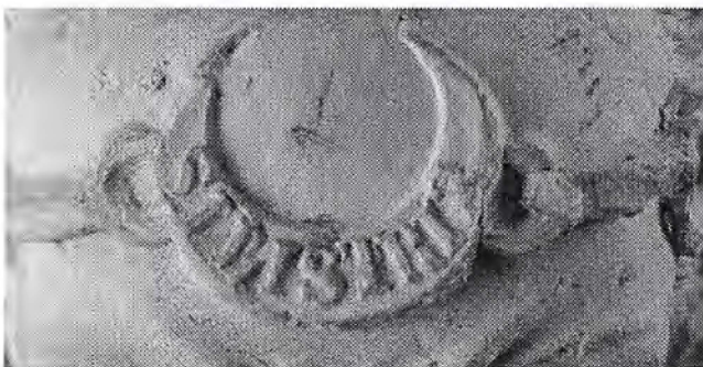
Silistria op het voorhoofd