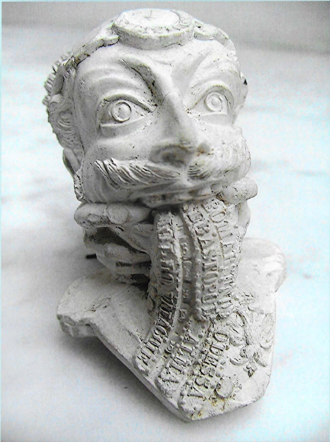
Karikatuurpijp gemaakt door de firma Cretal Gallard (Fr.) kort na 1856, ter gelegenheid van de beëindiging van de Krimoorlog. Zie pagina 2251