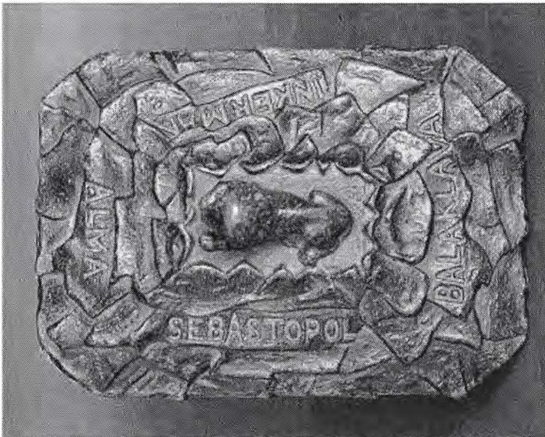
Deksel met de namen: Alma, Sebastopol, Balaklava en Inkerman. Deze 4 namen staan ook op de gespen van de Britse herinneringsmedaille