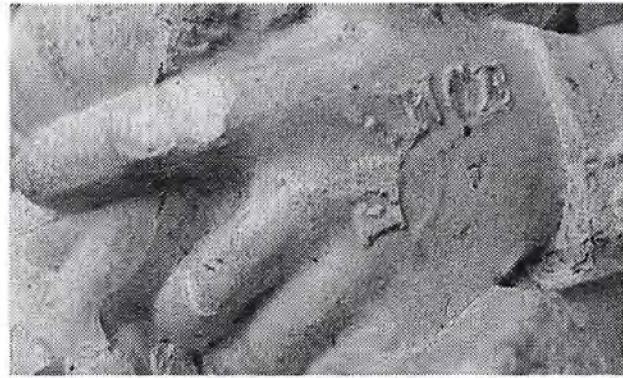
Op de handen de overwinnaars Angleterre en France