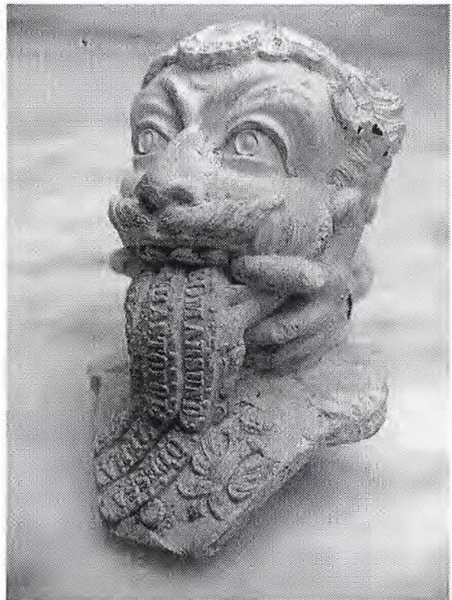
Karikatuur van Tsaar Nicolaas I