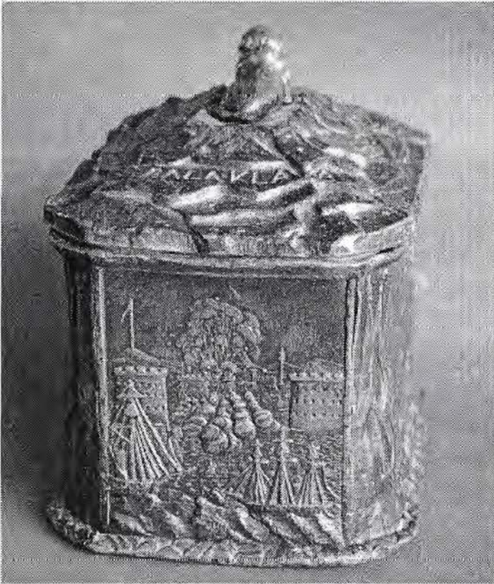
Bombardement vanuit zee