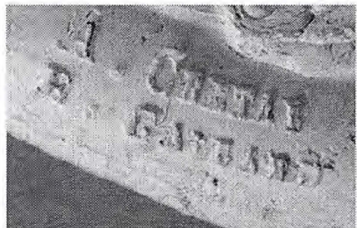
Fabrieksmerk Cretal Gallard

Het model van de pijp stelt een karikaturale weergave voor van tsaar Nicolaas I, wiens mond wordt geopend door twee handen van de overwinnaars Frankrijk en Engeland. Uit zijn mond staan op de tong de namen