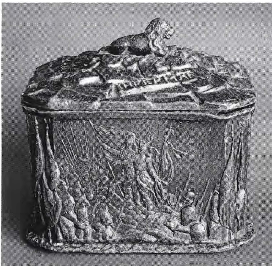
Engelse loden tabakspot. Afbeelding het gevecht op de Krim. Afmetingen: lengte 14,8 cm, breedte 10,9 cm, hoogte 13,8 cm. Gegoten door Stock & Son in 1856

SEBASTOPOL . Het uiteindelijke doel van de geallieerden was Sebastopol, waar de Russische vloot haar thuishaven had. De Engelsen durfden het enige fort dat nog in Russische handen was niet aan te vallen en lieten het veroveren van Sebastopol grotendeels over aan de Fransen. Na zware strijd werd op 8 september 1855 de stad veroverd en werden de Russische schepen tot zinken gebracht.